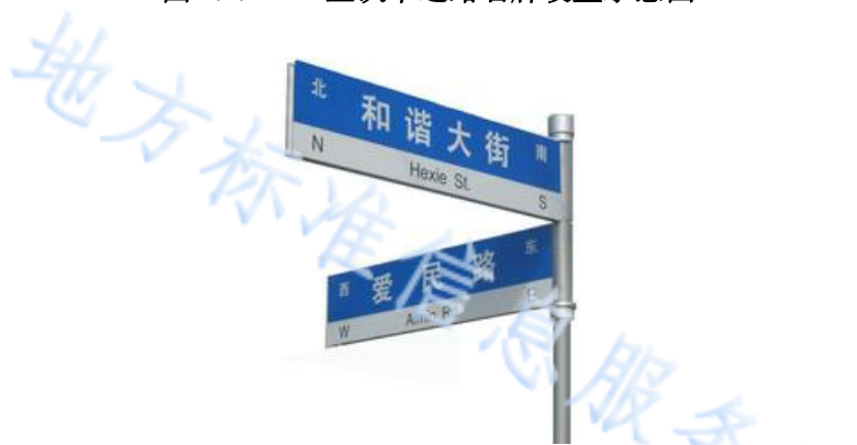
图 4.4.2-2 转角处设置路名牌样式示意图

4 根据《城市道路交通标志与标线设置规范》（GB 51038）4.3.6.1 规定，在人行道上，行驶机动车类型为行人时，交通标志板面下缘至路面最小净高为 2.5m。4.3.6.3 规定，当设置于人行道、非机动车道侧时，标志板下缘距离路面的高度应不小于 1.8m。通过与威海市交警部门对接，目前威海市威海市现有路名牌均按照 2.1m 净高设置。故本导则要求路名牌净高不小于 2.1 米。